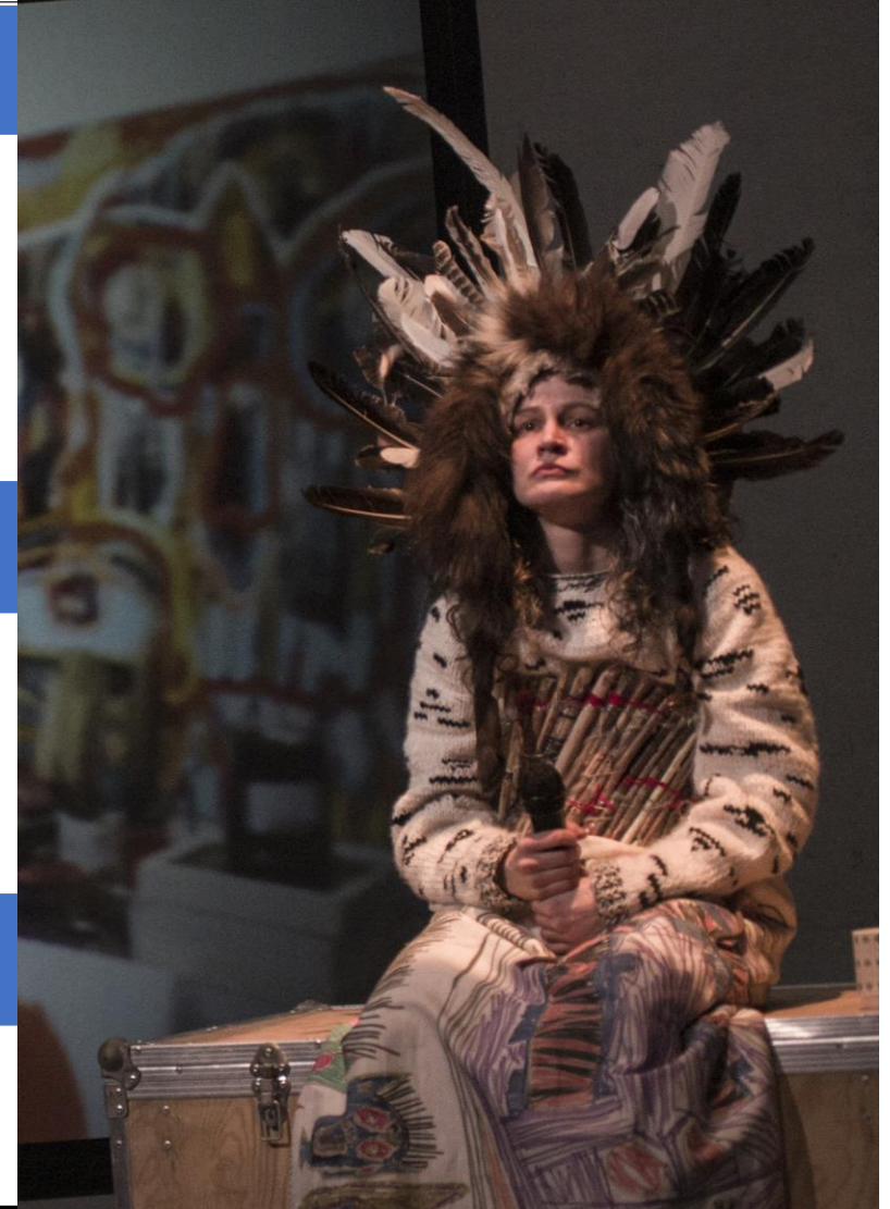
Představení Skugga Baldur, Studio Hrdinů